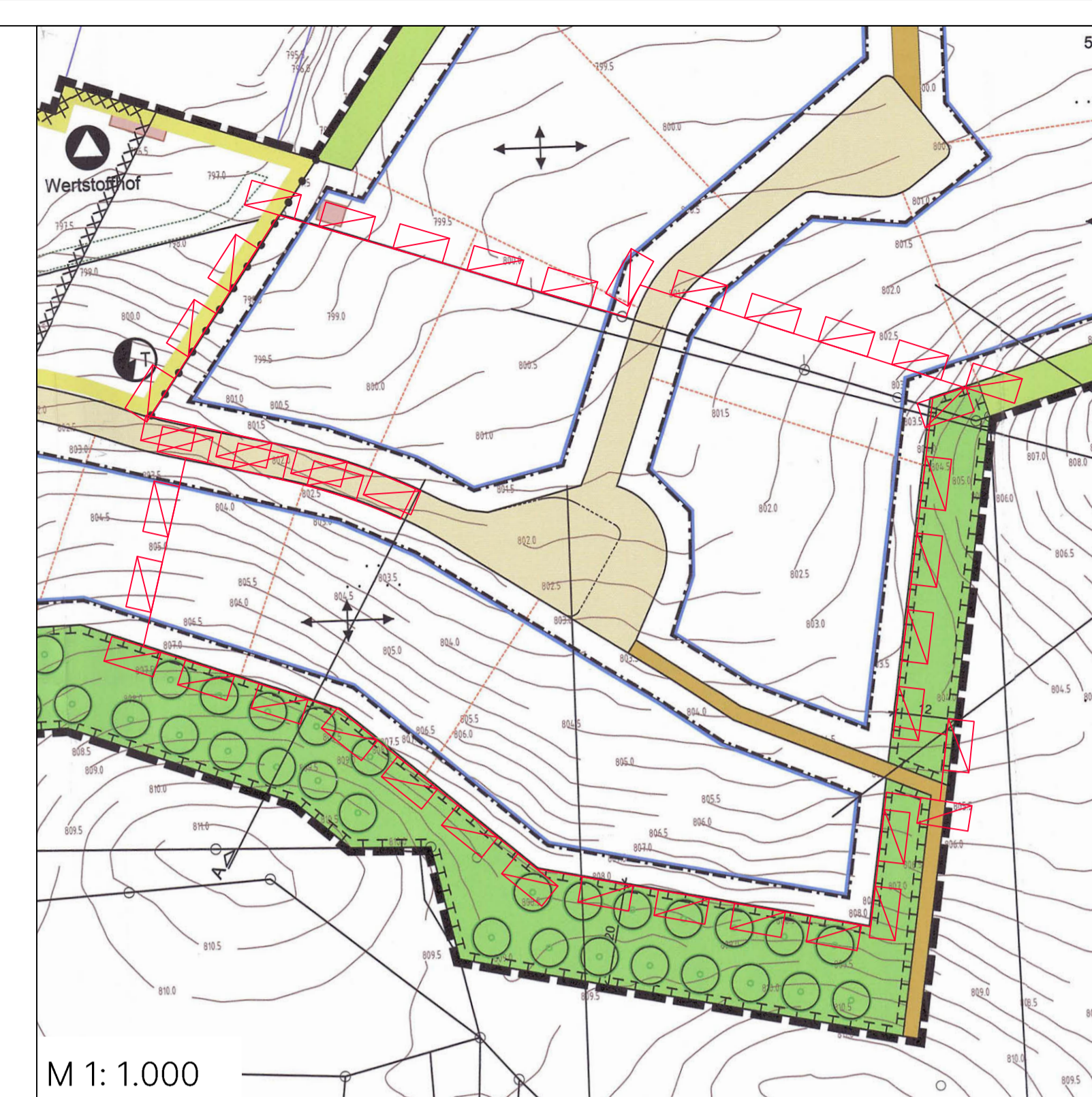
Bebauungsplan "Gewerbegebiet am Burgstall" (Fassung vom 20.10.2015, rechtsverbindlich seit 04.03.2016)