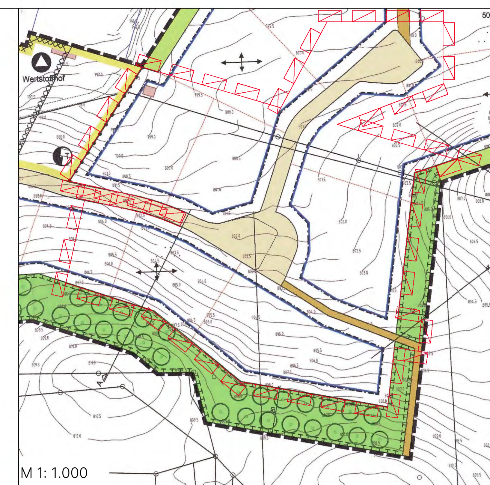
Bebauungsplan "Gewerbegebiet am Burgstall" (Fassung vom 20.10.2015, rechtsverbindlich seit 04.03.2016)